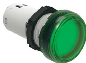
Jednoczęściowa lampka LED, światło ciągłe LPML