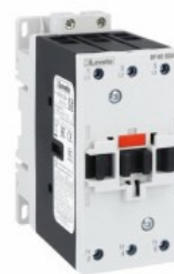
Stycznik mocy BF40