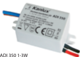
ADI 350 1-3W