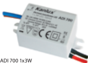
ADI 700 1x3W