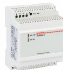
Modułowe zasilacze impulsowe PSL1M