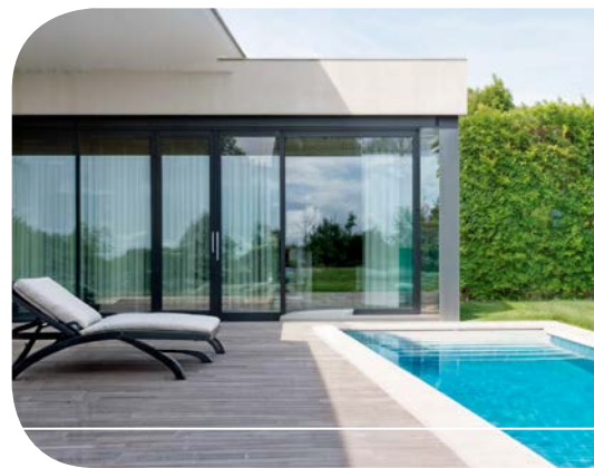
antracytowy RAL 7016