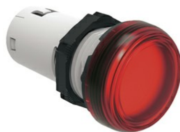
Jednoczęściowa lampka LED, światło ciągłe LPML