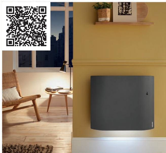
model HORIZONTAL ANTHRACITE