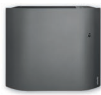
Antracyt (RAL 7016)