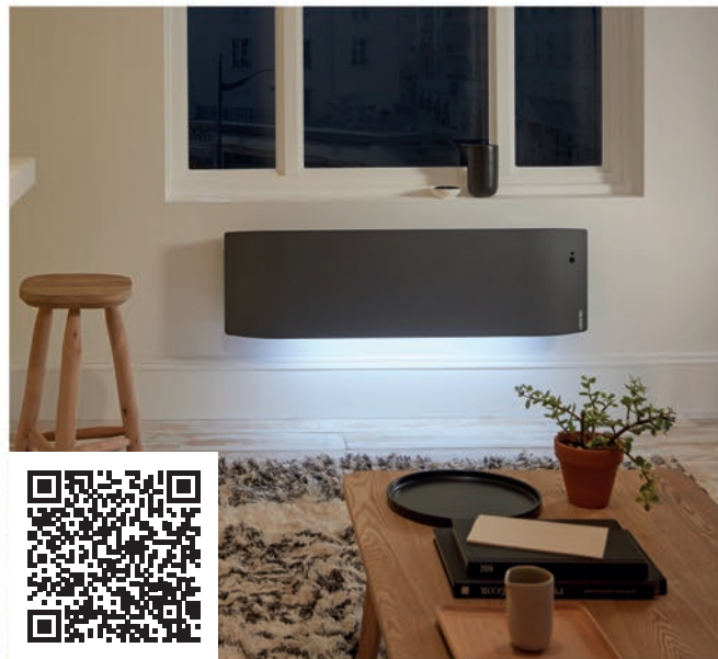
model PLINTHE ANTHRACITE