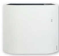
Biały (RAL 9016)