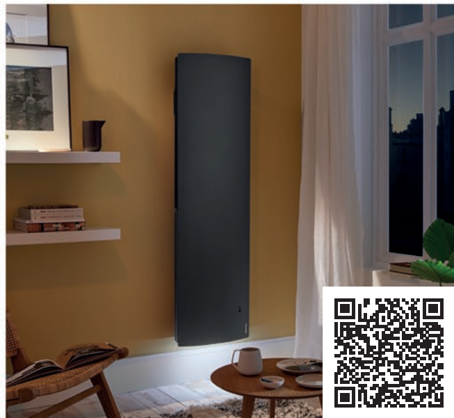
model VERTICAL ANTHRACITE

* możliwa oszczędność energii dzięki zastosowaniu systemu sterowania