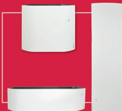
model PLINTHE model HORIZONTAL