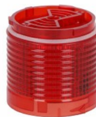
Kolumna sygnalizacyjna Ø50mm/1,97" LTN50