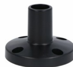
Kolumna sygnalizacyjna Ø50mm/1,97" LTN50