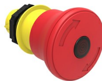
Podświetlane przyciski (grzybkowe) - do zatrzymania awaryjnego LPCBL66