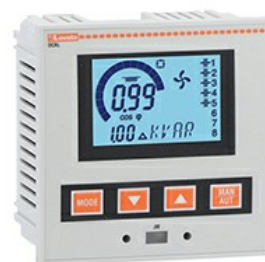
Automatyczny regulator współczynnika mocy, 5 stopni, wyświetlacz z ikonami DCRL5