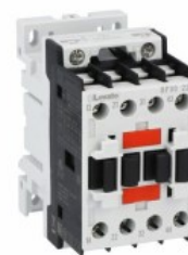
Stycznik pomocniczy BF00