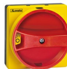
Pokrętła do rozłączników izolacyjnych GAX6