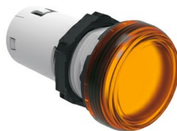
Jednoczęściowa lampka LED, światło ciągłe LPML