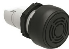
Jednoczęściowy sygnalizator dźwiękowy, sygnał ciągły lub przerywany LPCZS