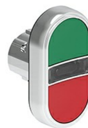
Przyciski dwukławiszowe z samoczynnym powrotem i białym, podświetlanym wskaźnikiem – dwa kryte LPSBL71