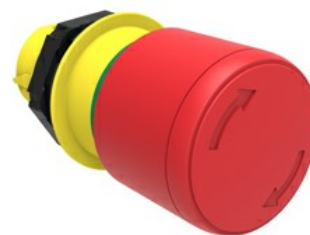
Przycisk do zatrzymania awaryjnego (grzybki), blokowany, odblokowanie przez obrót Ø 30 mm/1,2" LPCB663