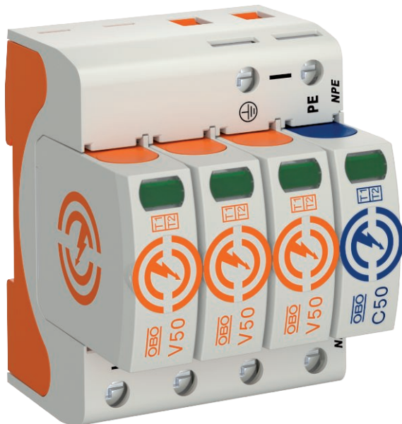
Ogranicznik przepięć Typ 1+2