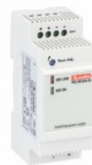
Modułowe zasilacze impulsowe PSL1M