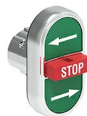
Przyciski trzyklawiszowe, samoczynny powrót - środkowy wystający LPSB73