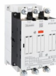
Stycznik mocy BF230