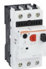
Wyłącznik silnikowy SM1P