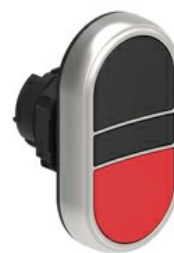
Przyciski dwuklawiszowe z samoczynnym powrotem – dwa kryte LPCB71