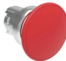
Przycisk do zatrzymania awaryjnego (grzybek), samoczynny powrót, Ø 40 mm/1,6" LPSB614