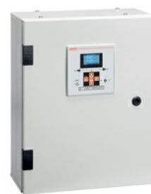
Układ SZR w obudowie ze sterownikiem ATL600 i 4-półowymi stycznikami, 60 A ATP