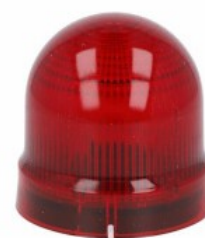
Sygnalizatory optyczne Ø62mm/2,44" 8LB6GL