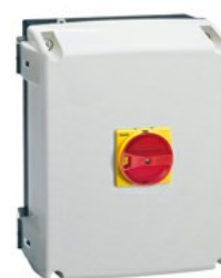
Puste obudowy, z tworzywa sztucznego GAZ