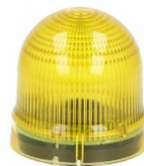
Sygnalizatory optyczne Ø62mm/2,44" 8LB6S