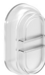
Gumowa osłona do przycisków dwu- i trzyklawiszowych, przezroczysta LPXAU157