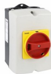
Puste obudowy, z tworzywa sztucznego GAZ