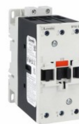
Stycznik mocy BF50