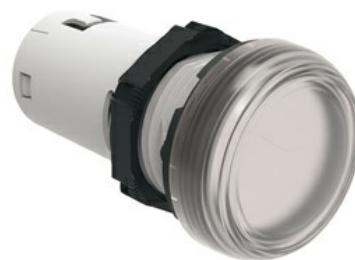
Jednoczęściowa lampka LED, światło ciągłe LPML