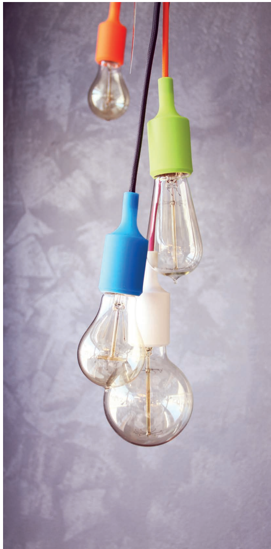
Kable w kolorowym oplocie