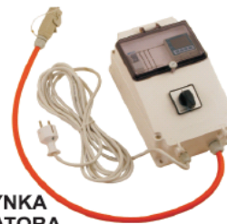
SKRZYŃKA REGULATORA TEMPERATURY