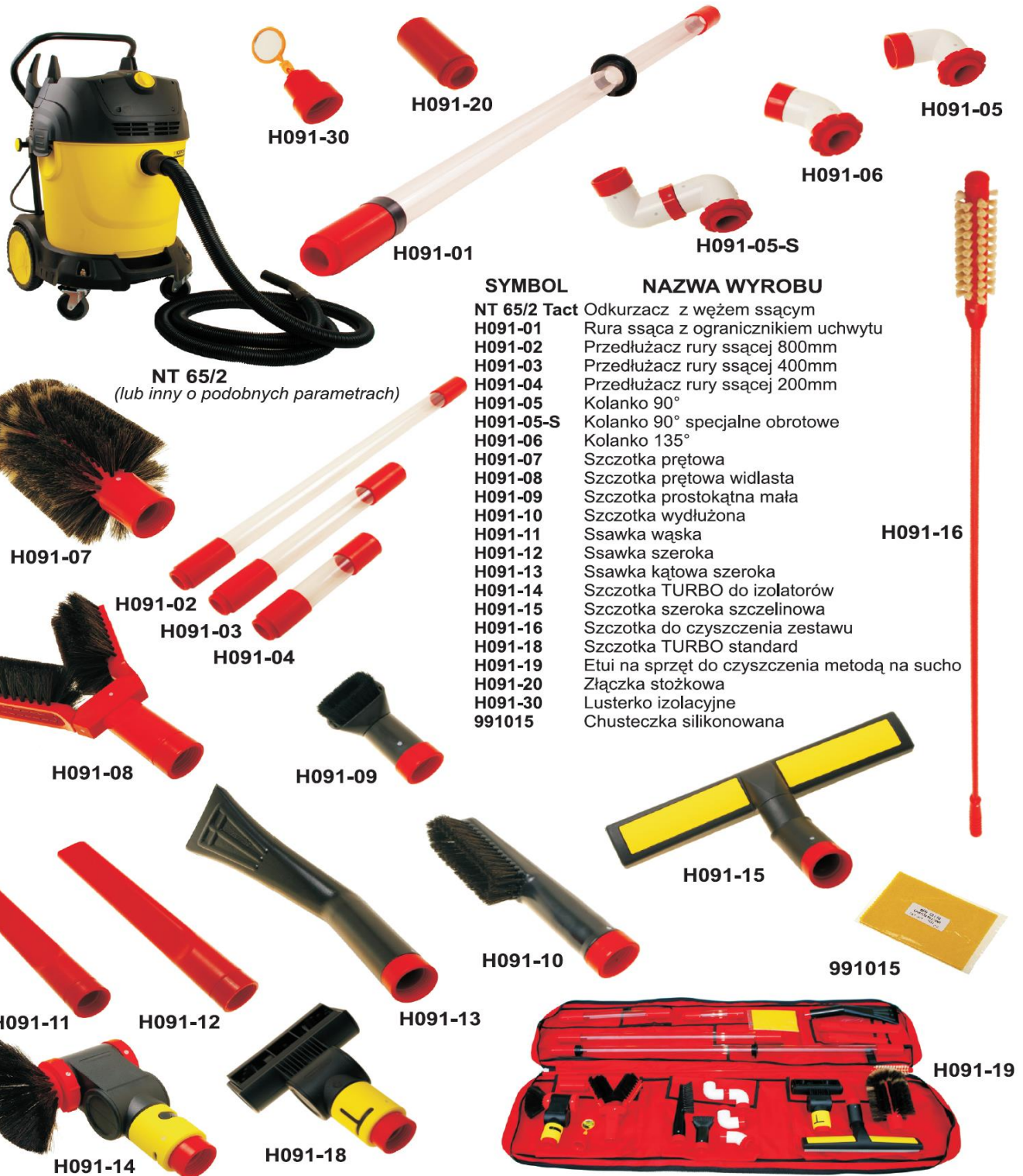
NT 65/2 (lub inny o podobnych parametrach)